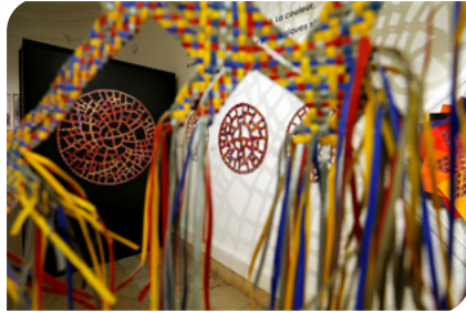
odon, vue d'exposition , 2017