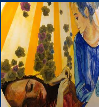
Fresque du collectif Garidel © FADS

C'est dans ce contexte que naissent régulièrement de belles idées qui ne demandent qu'à éclore telles que les 8 projets présentés lors de cette 4 e Nuit de la Philanthropie.