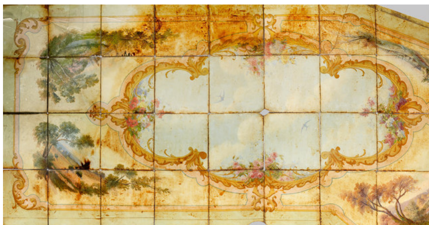
Plafond de boulangerie, panneaux de toile peinte marouflée sur carreaux de verre

rendez-vous des amoureux de Paris, qu'ils soient vendeurs ou acquéreurs", a indiqué à l'AFP Me Christophe Lucien, commissaire-priseur. Ces objets sont souvent issus de collections de particuliers, qui se passionnent pour le patrimoine de la capitale.