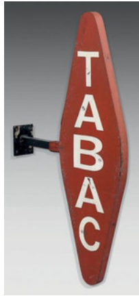
Carotte de bureau de tabac (tôle peinte, 1950) - Vente "Paris mon amour" 2014

Le lot le plus cher de la vente est constitué par une paire de lampadaires de la seconde moitié du 19e siècle, estimée à 26.000 euros et dont les éléments (fûts et lanternes) proviennent de la cour du Louvre.