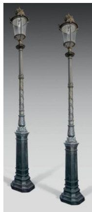
Paire de lampadaires, éléments anciens Modèle de la Cour Napoléon du Louvre - Vente "Paris mon amour" 2014

Le lot le plus cher de la vente est constitué par une paire de lampadaires de la seconde moitié du 19e siècle, estimée à 26.000 euros et dont les éléments (fûts et lanternes) proviennent de la cour du Louvre.