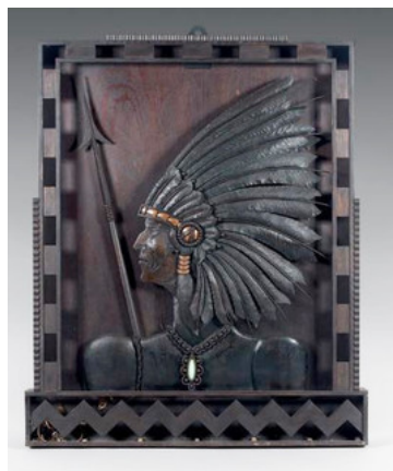
Décor de maison close en tôle patinée, 1920-30) Vente "Paris mon amour" 2014

Deux décors de salon de maison close (1920-1930), des panneaux sculptés de fer et de tôle patinée, estimés entre 3.000 et 4.000 euros chacun, seront aussi cédés au plus offrant.